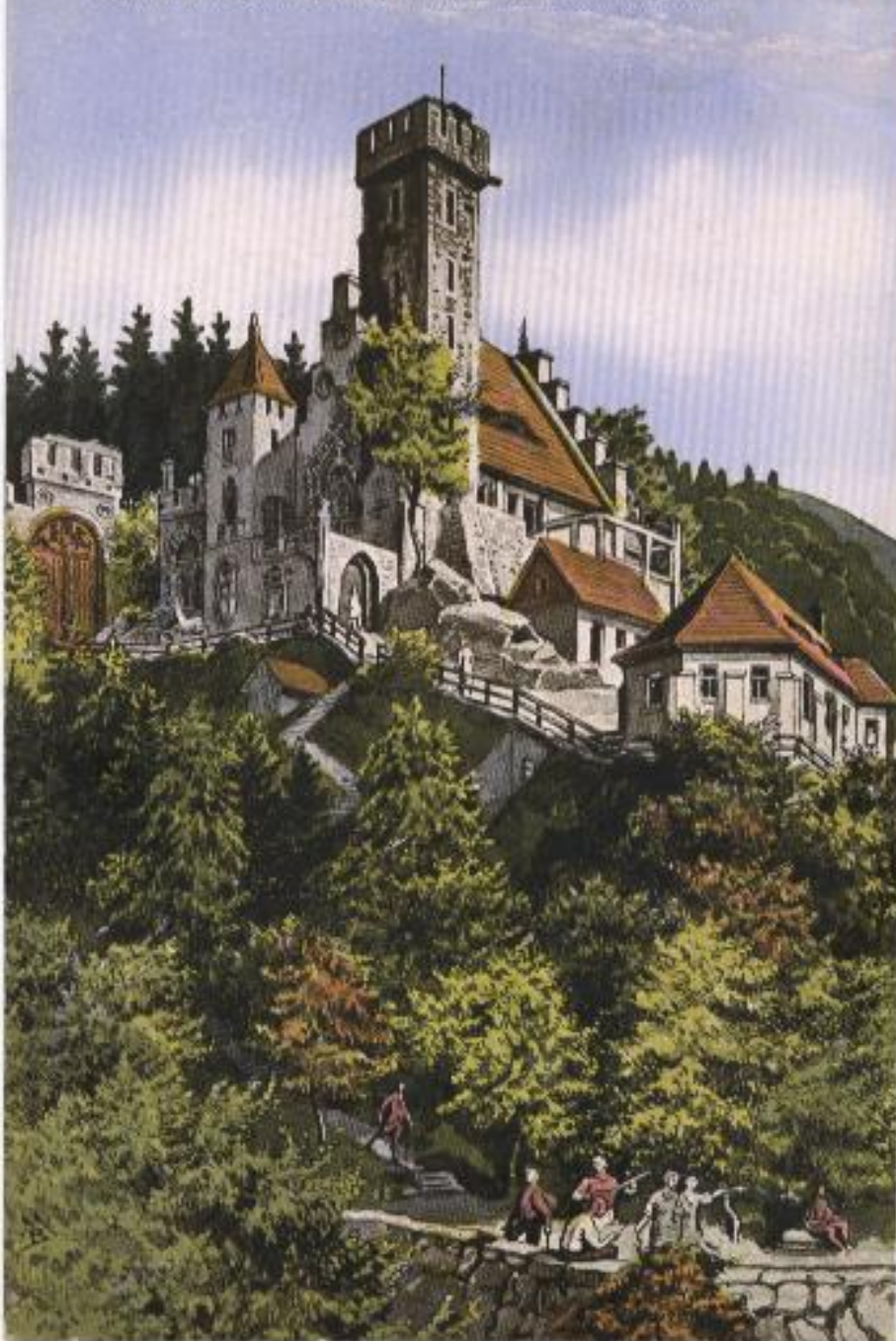
Die Neidburg im Queisstal, Marklissa-Goldentraum